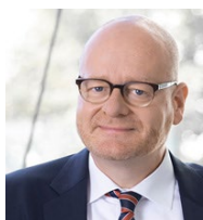
Bernd Schlömer Gastgeber des 11. Fachkongresses Staatssekretär und CIO des Landes Sachsen-Anhalt

Wir freuen uns auf ein persönliches Wiedersehen in der schönen Händel-Stadt Halle (Saale).