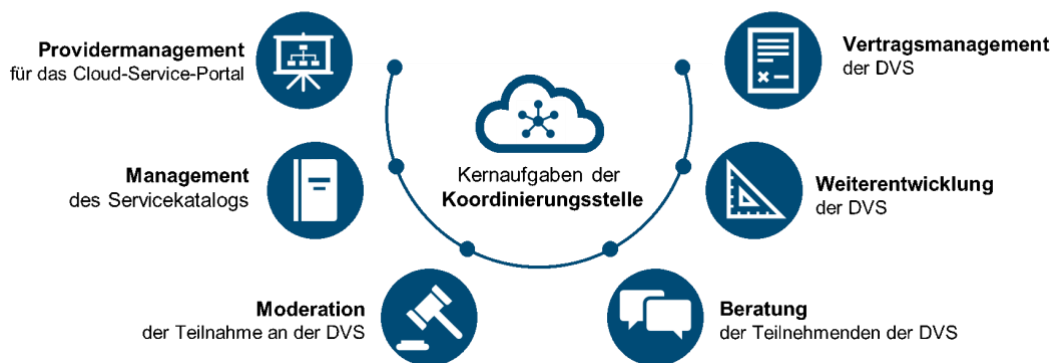
Abbildung 3: Kernaufgaben der Koordinierungsstelle

Gemäß Rahmenwerk der Zielarchitektur soll mit der Koordinierungsstelle zunächst ein zentrales Entwicklungs- und Steuerungselement für die DVS und das CSP geschaffen werden. Im Rahmenwerk der Zielarchitektur wurden dazu erste Kernaufgaben der Koordinierungsstelle festgelegt, die nachfolgend näher beschrieben werden. Abbildung 3 bietet eine Übersicht über die Kernaufgaben der Koordinierungsstelle.